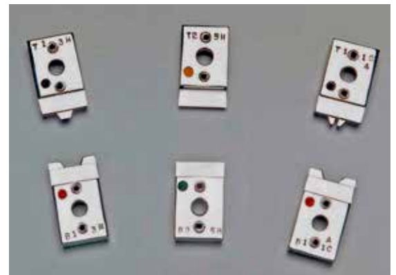
Ejemplos de dados y cuchillas de la CF-9